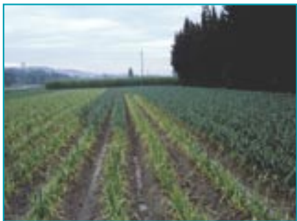
Sur cette photo les plantes jaunes sont issues de plants forains et virosés. Les plantes bien vertes, à droite, sont issues de plants certifiés.

Une précaution indispensable : éviter de planter dans un sol qui a porté l'année précédente une plante de la même famille : ail, échalote, oignon, poireau.