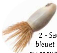
2 - Sauge des prés bleuet sauvage ou coquelicot ?