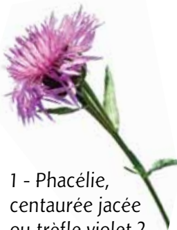
1 - Phacélie, centaurée jacée ou trèfle violet ?