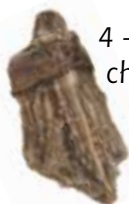
4 - Sainfoin, chicorée sauvage ou vipérine commune ?