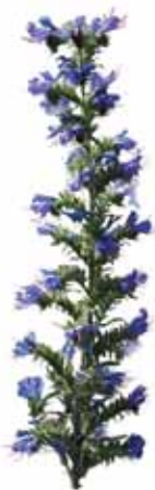
7 - Vipérine commune, sauge des prés ou phacélie ?