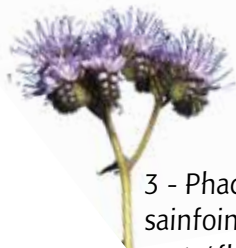
3 - Phacélie, sainfoin ou trèfle violet ?