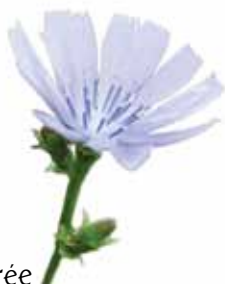
6 - Chicorée sauvage, mélilot ou bleuet sauvage ?