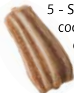
5 - Sainfoin, coquelicot ou chrysanthème des moissons ?