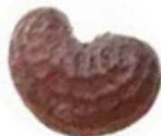
8 - Trèfle blanc, coquelicot ou sainfoin ?